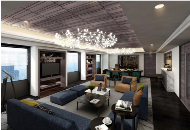
Imperial Suite(Living Room)完成予想図

スイスが得意とする木工技術にこだわり、曲げ加工を使った家具の設置や、木の格子を室内に取り付けるなど部屋のグレードが上がるほど木材を多くしております。 カラフルなクッションを誂え、スイスアルプスや大阪の風景写真を飾るなど、様々なアートワークを用いたインテリアでコーディネートしております。