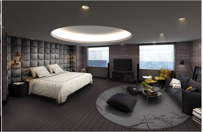
Imperial Suite(Bed Room)完成予想図