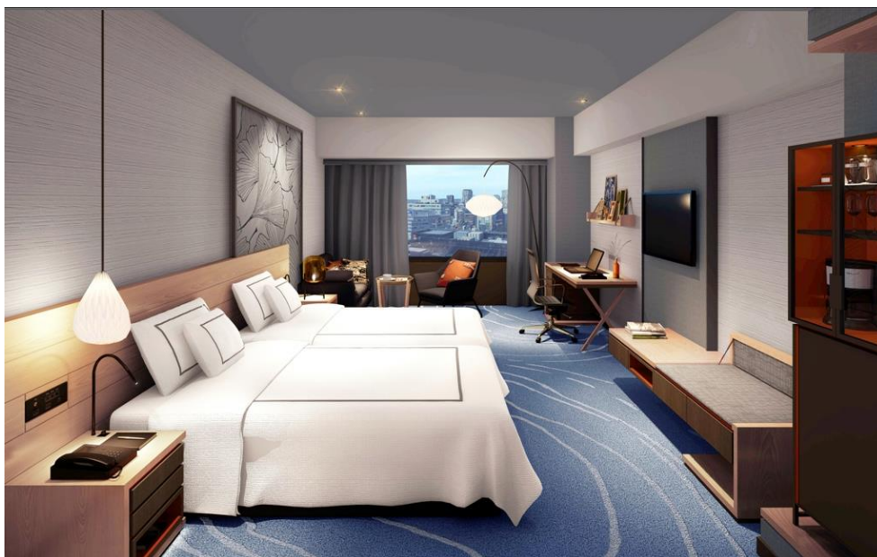
スイス セレクト ルーム 完成予想図

14 階 15 階の 47 室を改修致します。このプロジェクトは当ホテルの長期改装計画の一部であり、この 2 フロアを改修する事により開業以来、全フロアの改装が完了されます。「スイス セレクト ルーム」に部屋タイプを変更し、グレードを上げる事で客室単価のアップを期待しております。カーペット・家具などのインテリアや、天井・壁紙及びバスルームをアップグレードし、ビジネス利用にも最適なスマートデバイスに対応した設備を完備。“スイスホテルでしか実現できないジャパニーズモダンカジュアル”をコンセプトに、日本独自の伝統工芸を始め、緻密なディテール、素材感やカラースキムなどでスイスホテルならではのデザインに仕上げます。