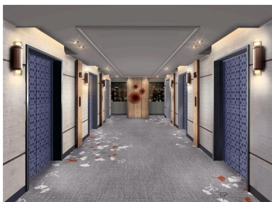
エレベーターホール 完成予想図