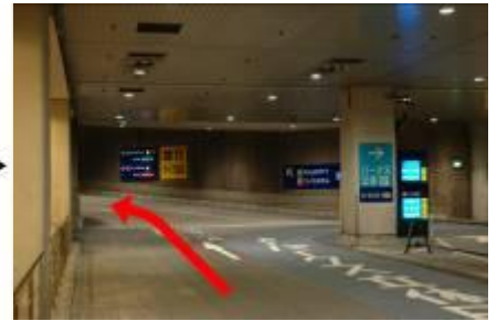
3. 駐車場内分岐にて左へ