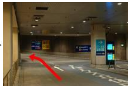
3. 駐車場内分岐にて左へ